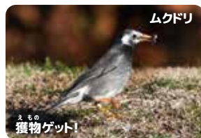
ムクドリ えもの獲物ゲット!

ムクドリは主に公園内で一年中観察できる留鳥です。繁殖地は立体駐車場のパイプの中! 園内の草木や芝生広場でエサをとってはせせと連んで子育てしています(子育ては春)。(大谷)