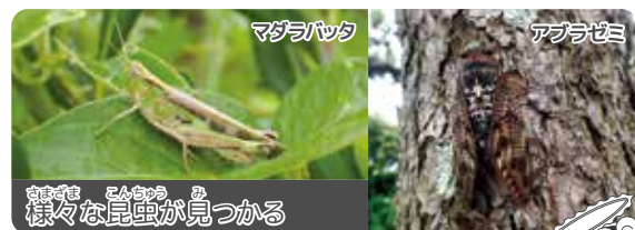
マダラバッタ アブラゼミ さまざまな昆虫が見つかる

さいご せんようつうろ ばい じゅもく しゅうへん さが ひかげ この 最後にスタッフ専用通路に入り、樹木の周辺を探します。日陰を好むチョウや甲虫、アリなども見つかります。夏にはセミも現れてとても賑やかです。3か所で昆虫を観察すると、場所によって全く異なる昆虫が見つかることに気づきます。種類によって棲息に適した環境は異なりますから、多様な環境があることが大切なのだということを、参加された皆さまに考えていただきます。