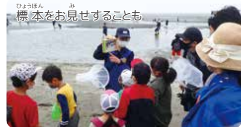
ひょうほん み 標本をお見せすることも

なみう ぎわ かいそう ひょうちやくぶつ ちい まずは波打ち際です。海藻などの漂着物をめくってみると、とても小さな昆虫が多く見つかります。海辺と昆虫なんて、一見何の関係もなさそうに感じるかもしれませんが、実は海辺の砂浜にしかないような昆虫たちがいるんです。昆虫は海藻や魚の死骸など、自然の漂着物を食べたり、隠れたりするのに利用しています。